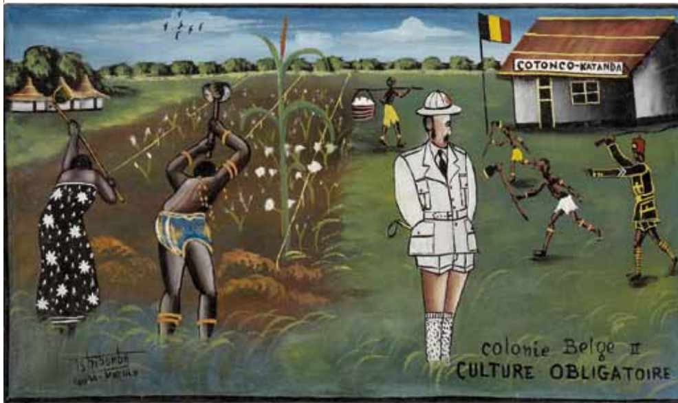
Colonie belge II, Culture obligatoire - Tshibumba Kanda-Matulu (1970)

⇒ révélera faux : le livre de Hochschild, est aujourd'hui incontournable dans l'historiographie de la colonisation belge, il fut traduit en douze langues et vendu à plus de 600.000 exemplaires.