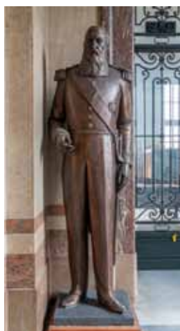
Léopold II, statue géante au Musée de Tervuren. Depuis 1956, le premier responsable des crimes coloniaux belges contre l'humanité est ainsi présenté à l'admiration du public.