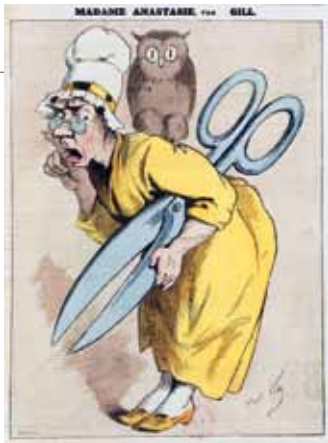
La censure, vue par Gill.

rain belge, en 1876, à l'ouverture de cette conférence, est de ceux qui méritent au premier chef d'occuper les amis de l'humanité. Ouvrir à la civilisation la seule partie de notre globe où elle n'ait point encore pénétré, percer les ténèbres qui enveloppent des populations entières, c'est, j'ose le dire, une croisade digne de ce siècle de progrès. Ai-je besoin de vous dire qu'en vous conviant à Bruxelles, je n'ai pas été guidé par des vues égoïstes ? » (3). C'est au nom de ces buts « philanthropiques », ainsi que d'une promesse de liberté de commerce, que Léopold II acquit, en 1884 et de la part des Etats-Unis, la première reconnaissance internationale de son entreprise coloniale (4).