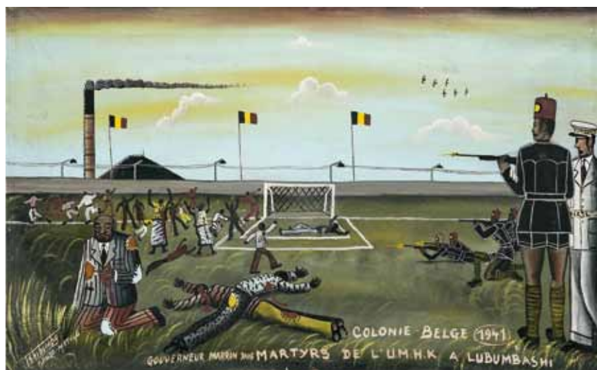
1941 : Colonie Belge 1941, Gouverneur Marron dans Martyrs de l'U.M.H.K à Lubumbashi - Tshibumba Kanda-Matulu circa 1970.

3 décembre 1941, des mineurs africains de l'Union Minière du Haut Katanga (UMHK) se mettent en grève pour obtenir une augmentation de salaire. 9 décembre « Le leader des grévistes, Mpoy Léonard, s'avança vers lui pour discuter. Maron [gouverneur du Katanga] fit signe à la troupe qui ouvrit un feu nourri. Mpoy fut fauché ensemble avec deux cent grévistes et proches. [...] La démonstration dans la capitale du cuivre de la force brutale, voulue par Motoulle [directeur de l'UM] fut complètement occultée dans la presse coloniale. [...] L'année suivante, Maron fut promu [...] L'Union Minière était quitte de grèves d'Africains pour le reste de l'existence du Congo belge. » Jules Marchal (1999), p. 197 - 199