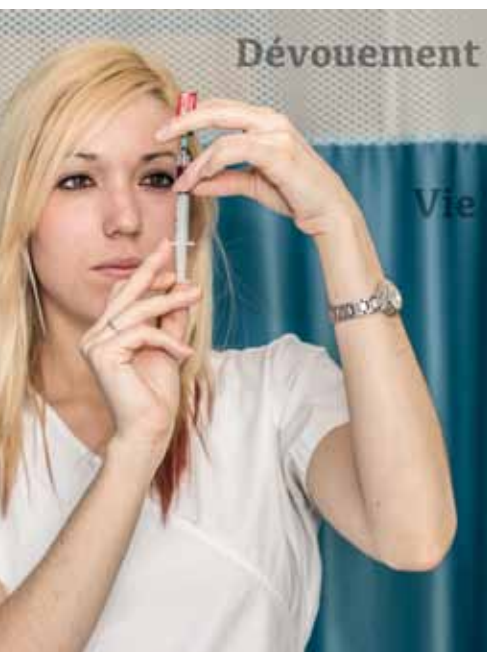
En soins palliatifs, l'écoute, l'accompagnement et le dialogue au chevet des patients font totalement partie du travail

C'est en fait une chance extraordinaire, mais aussi une arme à double tranchant, car cette expérience m'a rendue extrêmement sensible. □