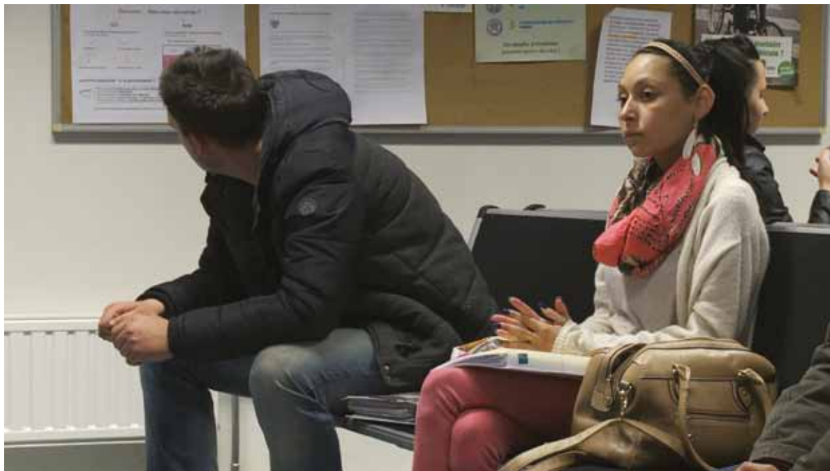
La salle d'attente, lieu de tensions et d'angoisse. (Extrait de Bureau de chômage)

points un recul des droits des demandeurs d'emploi à l'occasion d'une réforme qui prétend mieux les protéger. Les demandeurs d'emploi ne peuvent être traités comme des sous-citoyens. Quand l'administration est susceptible de prendre une décision qui va porter atteinte à leurs droits, ils doivent en être clairement informés à l'avance, pouvoir préparer et présenter leurs moyens de défense, la décision notifiée doit être accompagnée d'une motivation précise et complète, etc. Si le suivi du plan d'action formalisé est obligatoire, c'est dès l'imposition de ce plan que les demandeurs d'emploi doivent pouvoir être accompagnés et défendus.